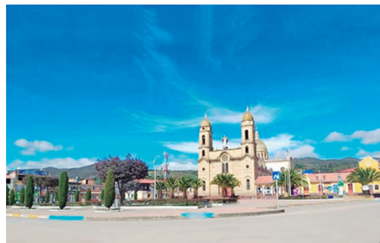
Municipio de Aquitania - Boyacá

Aquitania es un municipio ubicado en la Provincia de Sugamuxi y cuenta en su territorio con el Lago de Tota, y Playa Blanca, principales atractivos turísticos, en cuya rivera hay un sinnúmero de hoteles y centros deportivos. La localidad venera al Señor