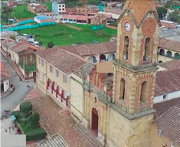
Municipio de Tuta- Boyacá

Es un municipio de la provincia del centro de Boyacá. El municipio se destaca por sus productos agrícolas: papa, cebolla, maíz, fresas y hortalizas.