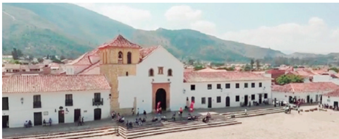
Municipio de Villa de Leyva.

El municipio de Villa de Leyva está ubicado en la Provincia de Ricaurte en el departamento de Boyacá. Es reconocido como uno de los municipios más bellos de Colombia. Monumento Nacional, Pueblo Patrimonio y Patrimonio de la Humanidad declarado por la UNESCO.