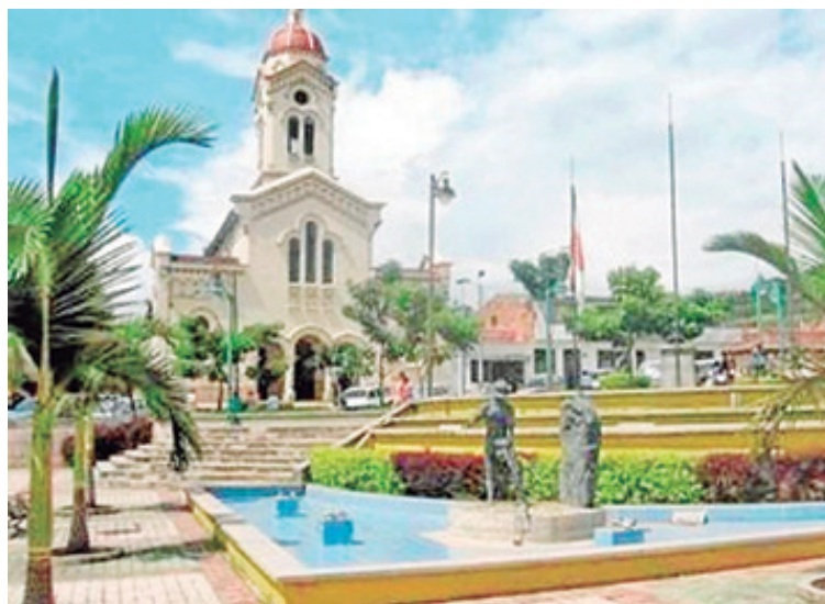
Municipio de Santana – Boyacá

La Historia atribuye su creación como centro de habitación obligada por el desplazamiento de los habitantes de la encomienda de "CHIMANA", quienes huyendo del peligro por sus vidas, construyeron un fuerte militar dotado para su defensa y le llamaron "Encomienda