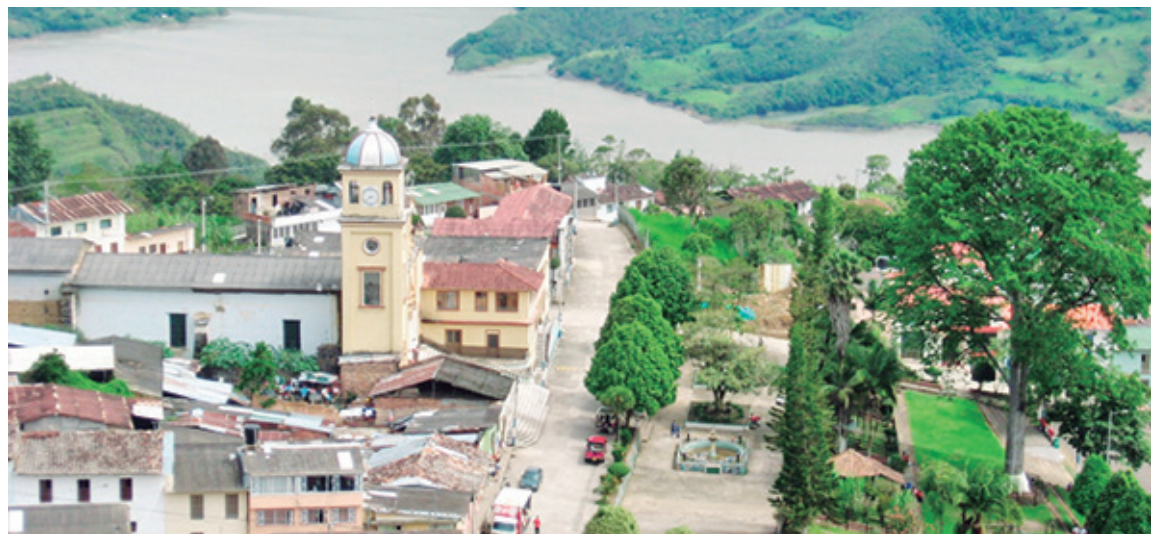
Municipio de Tenza- Boyacá

Tenza es un municipio ubicado en el Valle de Tenza en Boyacá. Tenza o Tenazucá significa "bajar o detrás" del Boquerón. Su historia se remonta a una población indígena llamada tenazucá chibcha o muisca, subordinada al cacique tributario del Zaque de Hunza. Tenza tiene un atractivo microclima, y tiene dos ríos: Ga-